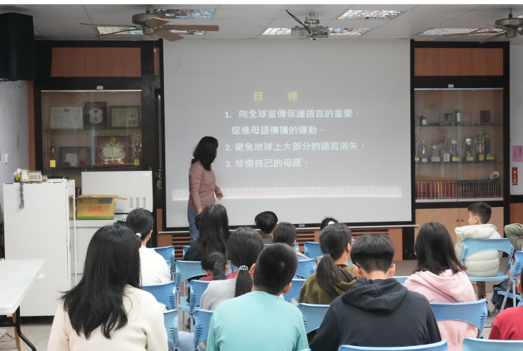
世界母語日的由來