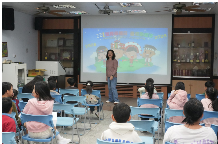
221世界母語日宣導活動