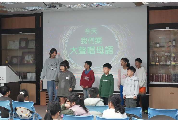
今天我們要大聲唱母語歌（閩南語）