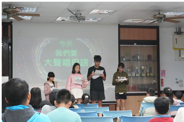
今天我們要大聲唱母語歌（阿美語）