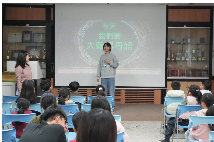
解釋歌詞的意思給同學聽