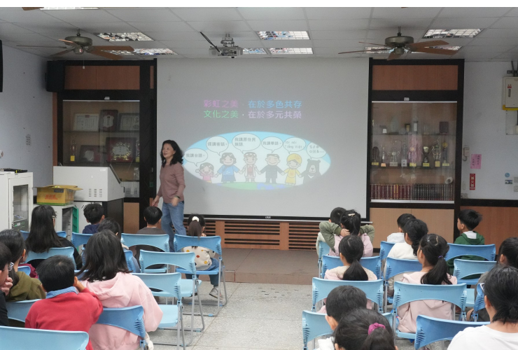
文化之美，在於多元共榮。