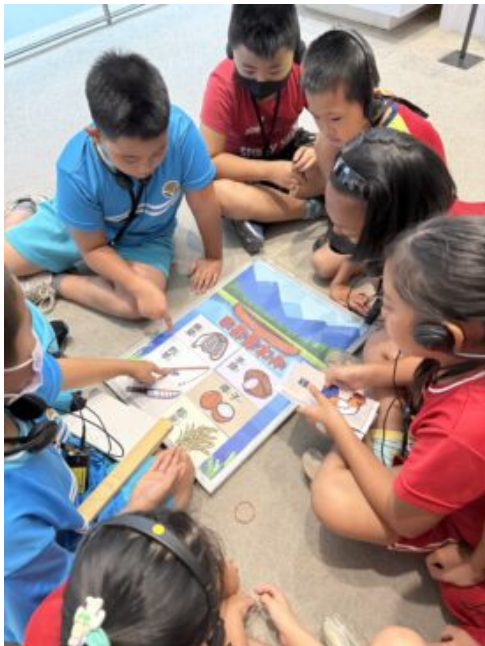
學生透過小組合作探討邵族的歷史、語言與傳統文化，培養合作能力並深化文化理解。