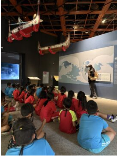
親身體驗原住民文化的多樣性與歷史脈絡，深化對本土文化的理解與尊重