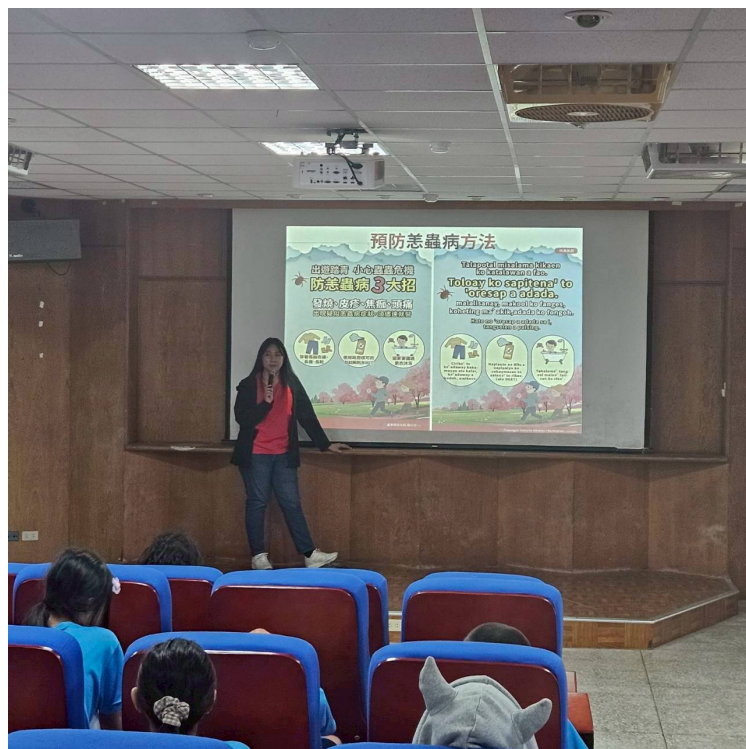
阿美語疾病怎麼說?