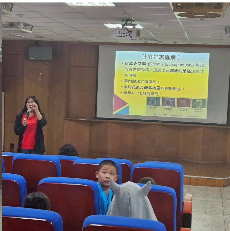
阿美語疾病怎麼說?-02