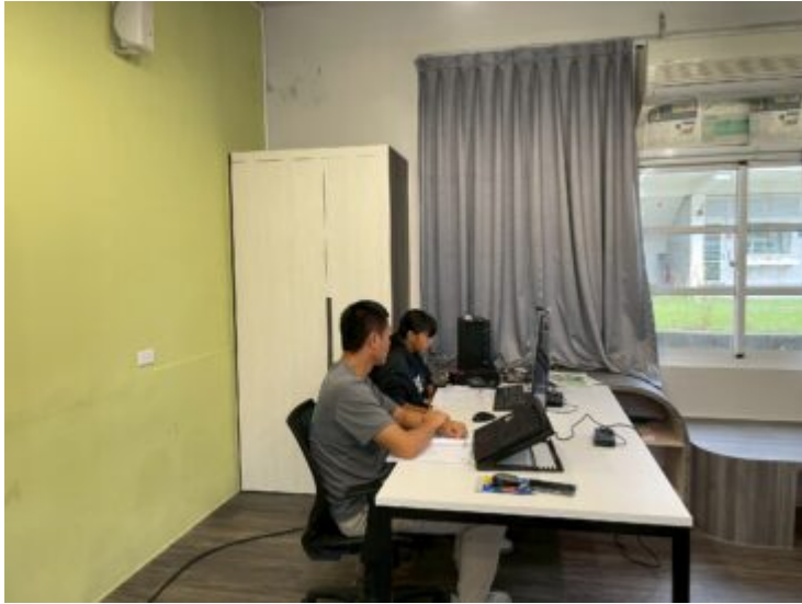
線上本土語教學同步觀課情形