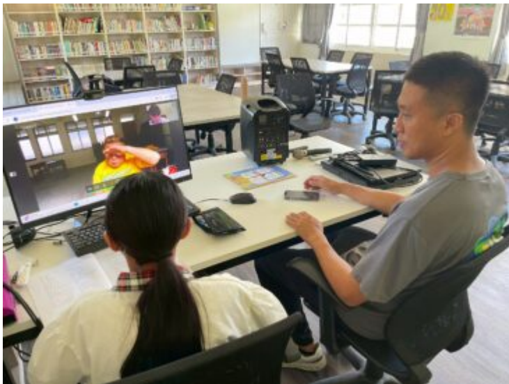
教師與學生進行電腦協作教學