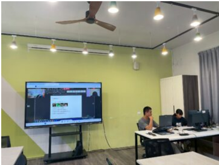
教師與學生進行電腦協作教學