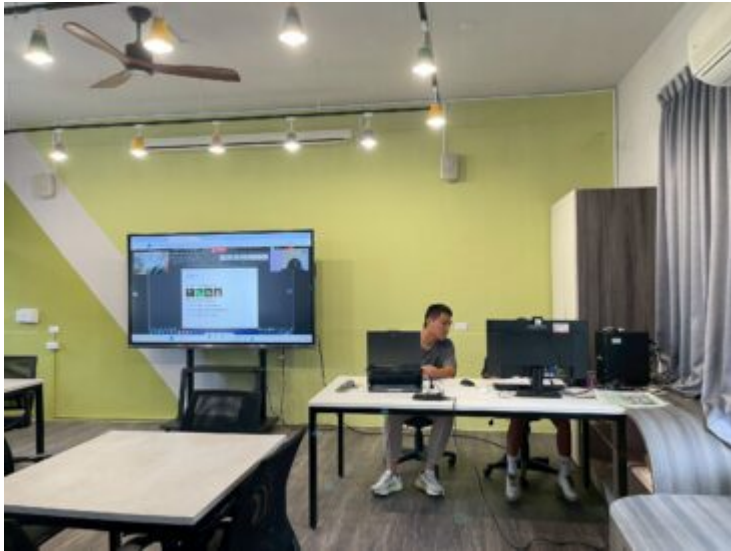
線上本土語教學同步觀課情形