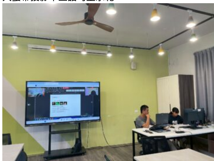
教師與學生進行電腦協作教學