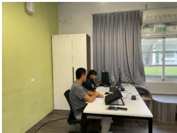
線上本土語教學同步觀課情形