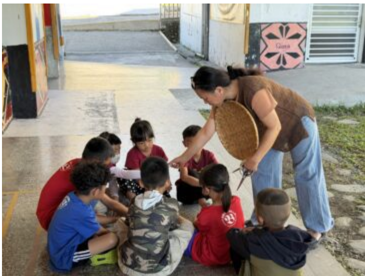
3.排灣語上課情形-認識原住民族植物(一年級)