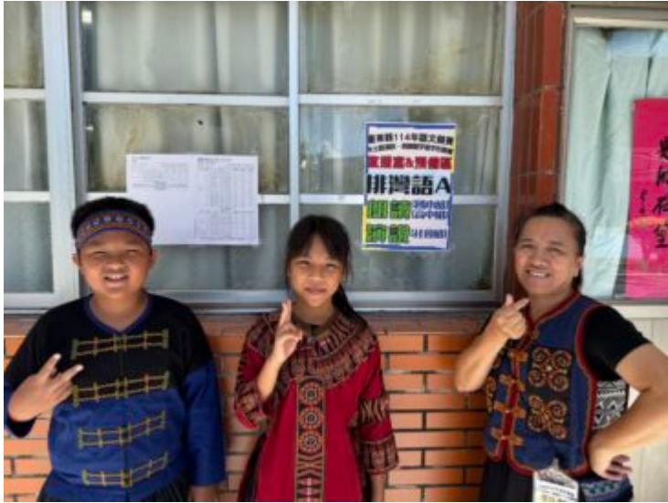
1.六年級學生參加114年度臺東縣族語朗讀比賽(排灣語)