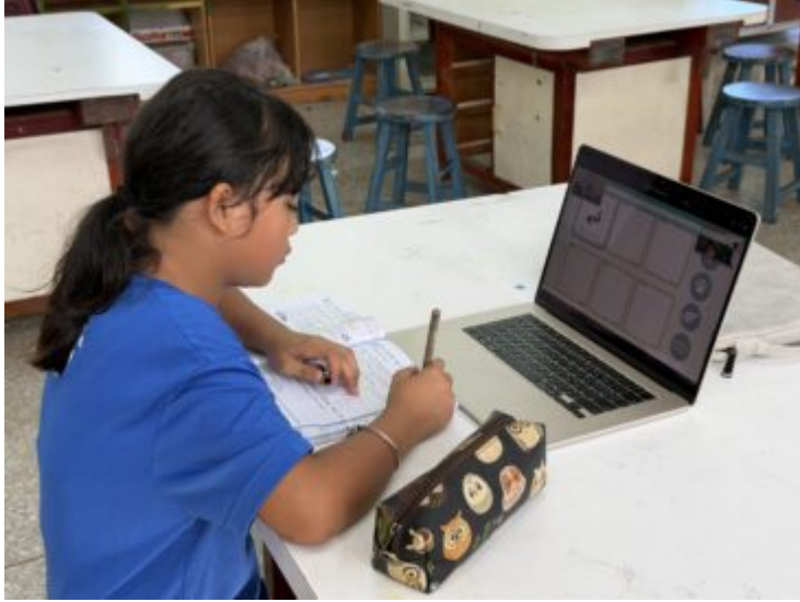
4.西群卑南語直播共學上課情形(四年級)