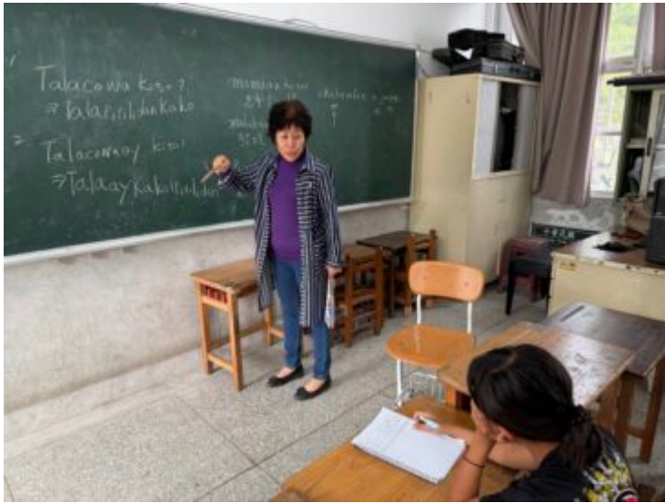
5.阿美語上課情形-日常生活用語(五年級)