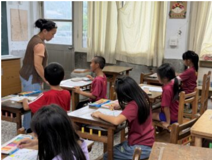
6.排灣語上課情形-節慶教學(二年級)