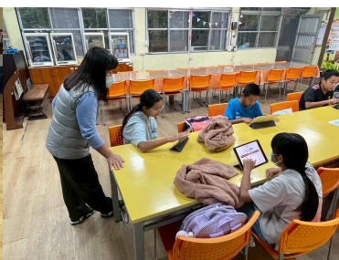
族語能力測驗線上練習 (2)