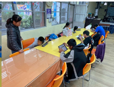
族語能力測驗線上練習 (3)