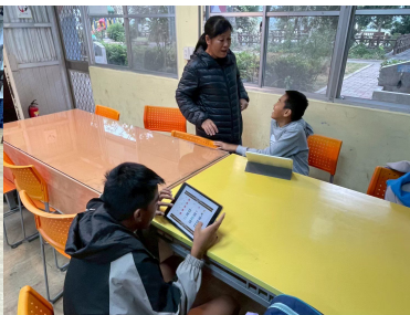
族語能力測驗線上練習 (2)