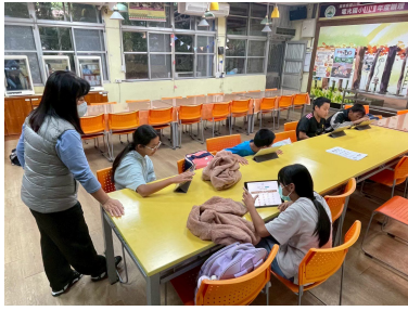
族語能力測驗線上練習 (4)