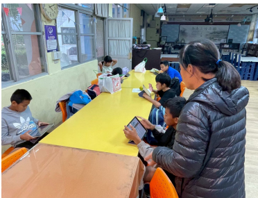
族語能力測驗線上練習 (1)