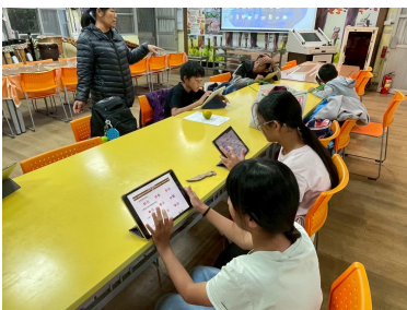
族語能力測驗線上練習 (4)