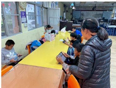
族語能力測驗線上練習 (1)