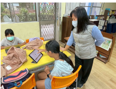
族語能力測驗線上練習 (1)