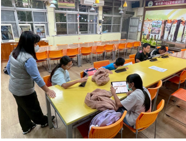
族語能力測驗線上練習 (4)