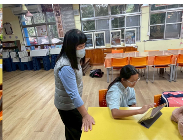
族語能力測驗線上練習 (3)