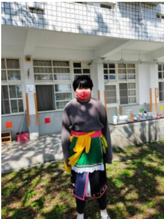
尊重個別的族群服飾