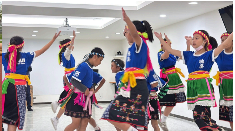
感謝企業贊助的感謝表演舞碼