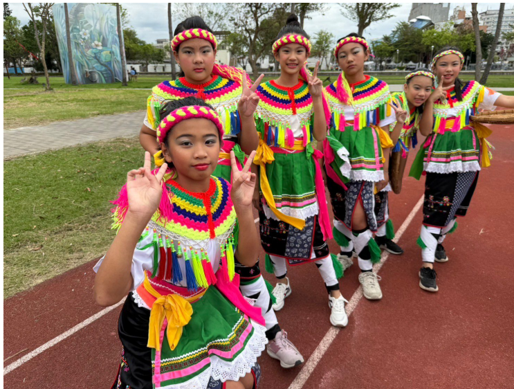
比賽前換完裝的合照