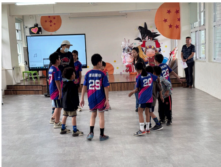
114新生體驗營-舞蹈初體驗