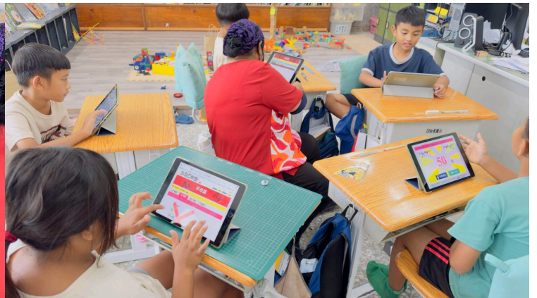
學生學習漸有成效