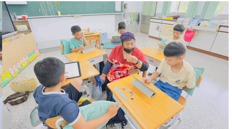
學生不會的會請教老師