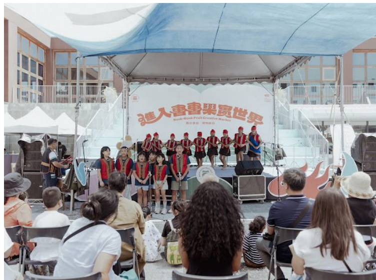
本校參加史博館活動