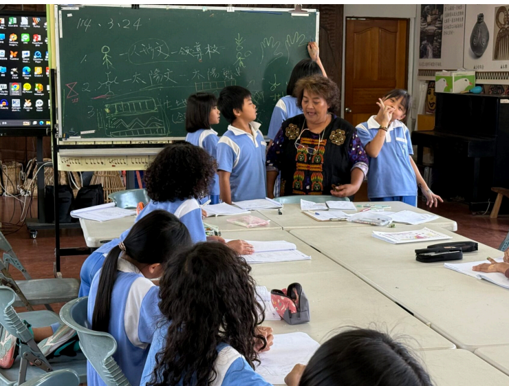
原住民族圖騰介紹族與學習