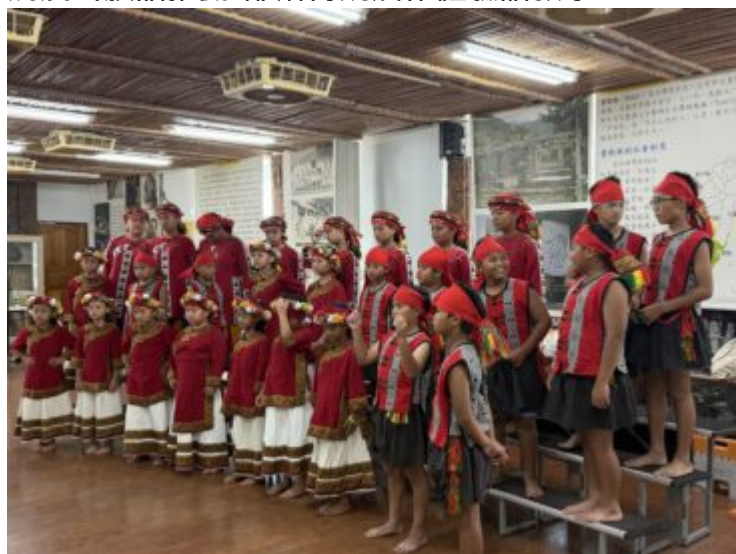
傳統歌謠合唱教學