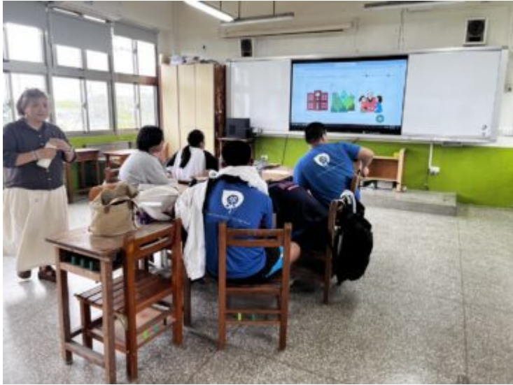
郡群布農語上課情形