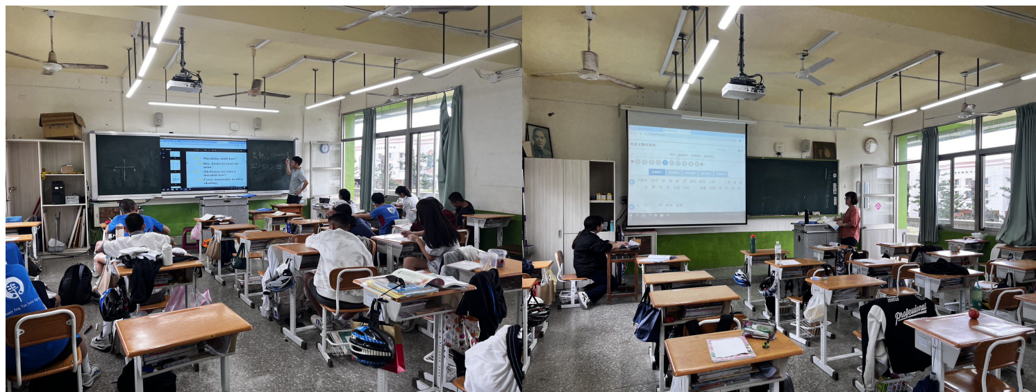
馬蘭阿美語上課情形