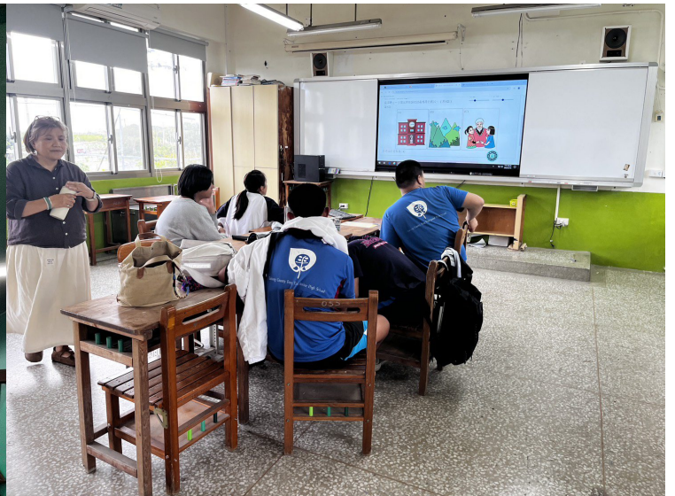
郡群布農語上課情形