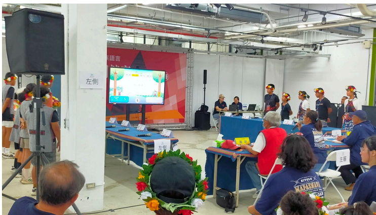
第十屆原住民族語單詞競賽-台東初賽