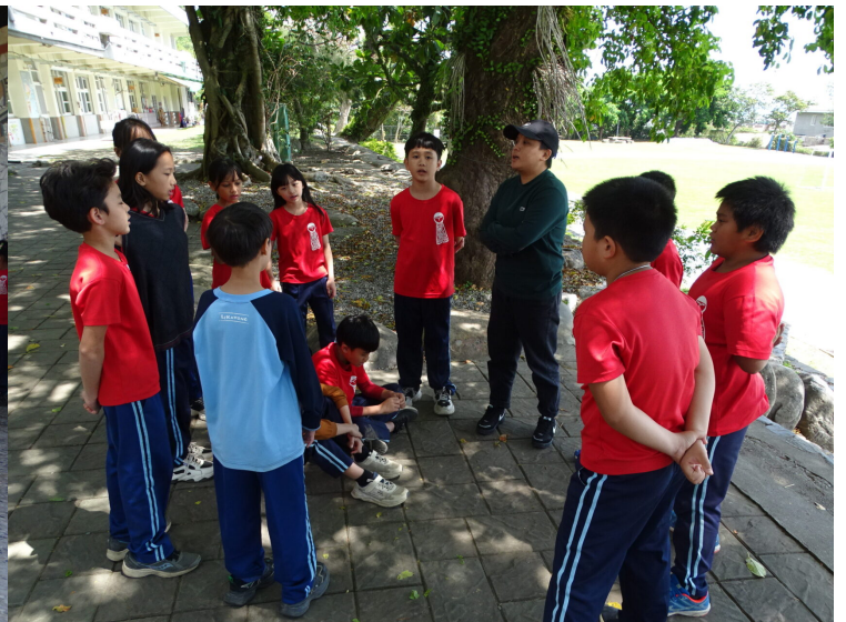
因應梅之宴音樂會進行歌謠教唱-高年級