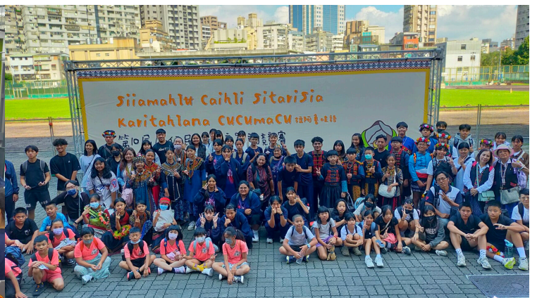
第十屆原住民族語單詞競賽-師大全國賽