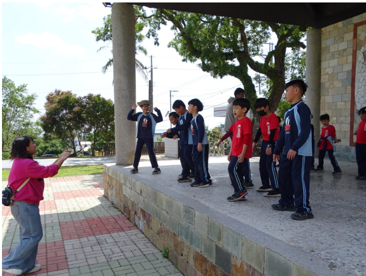
因應梅之宴音樂會進行歌謠教唱-中年級