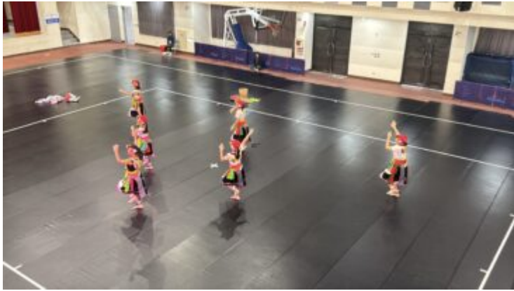
整齊一致的隊形變化，表現文化故事的延續與世代傳承。