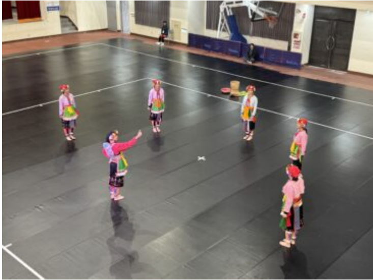
舞者於場地中圍成隊形，由領舞引導動作，象徵部落集體與文化傳承。