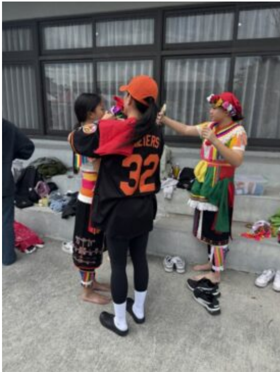
學生於後台互相協助整理族服，展現對原住民傳統服飾與儀式的尊重。