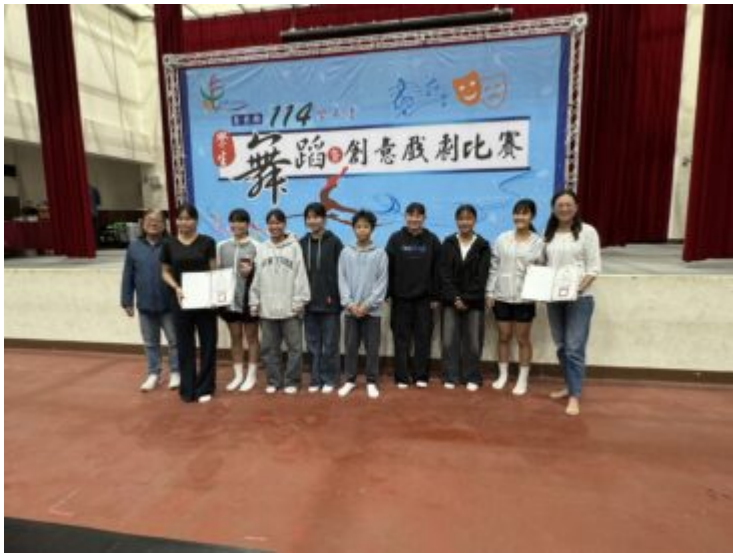
賽後全體合影留念，記錄學生參與舞蹈暨創意戲劇競賽的學習成果。