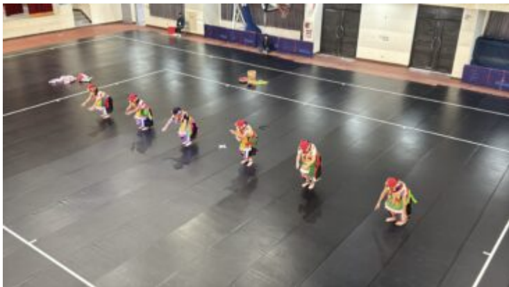
舞蹈動作結合節奏與肢體語彙，傳達原住民文化精神與情感。