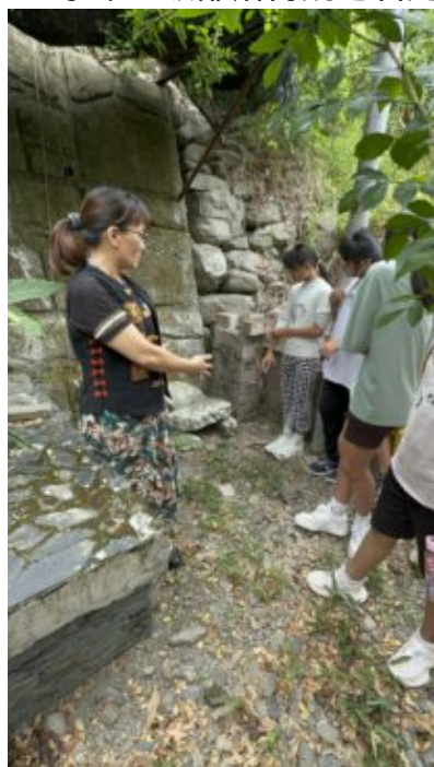
113學年部落巫師講解祭壇 作用與功能