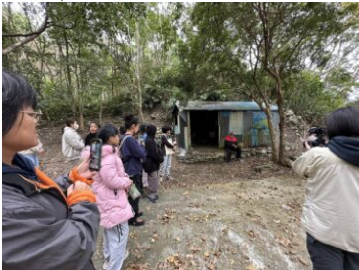
113學年tukusiya舊部落踏查與紀錄