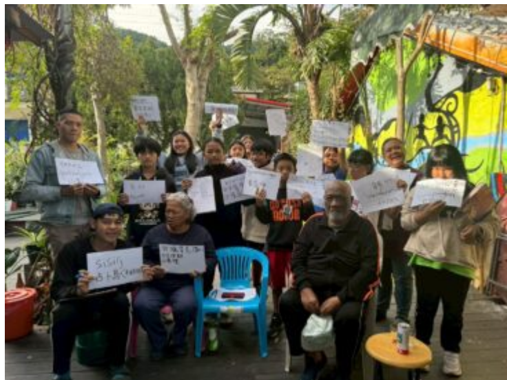
113學年土坂部落傳統地名走讀故事文學