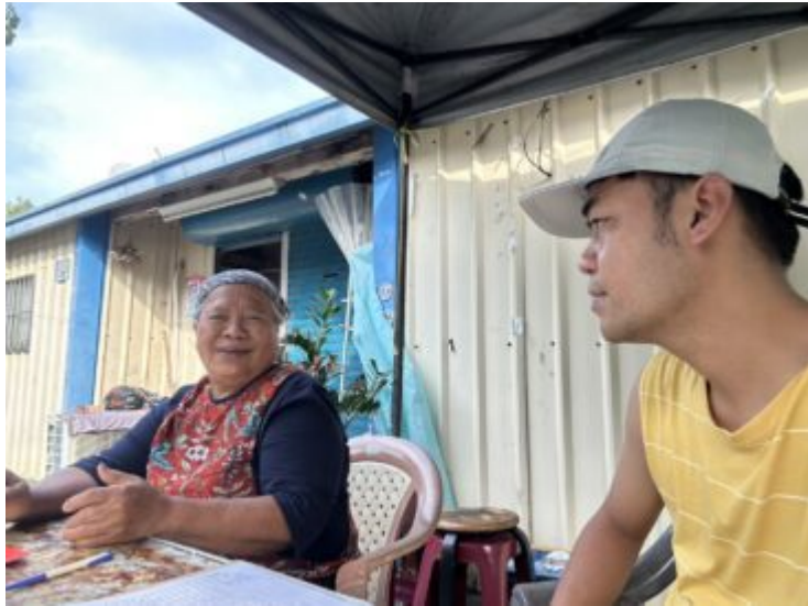
113學年訪談部落耆老-tjadriilik舊部落故事