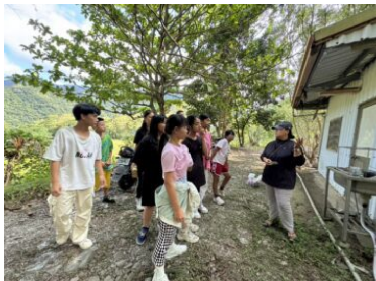
113學年parivengay舊部落踏查與紀錄