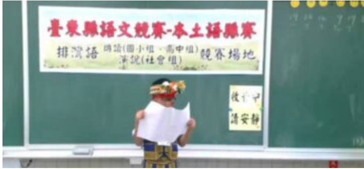
東排灣語朗讀實況