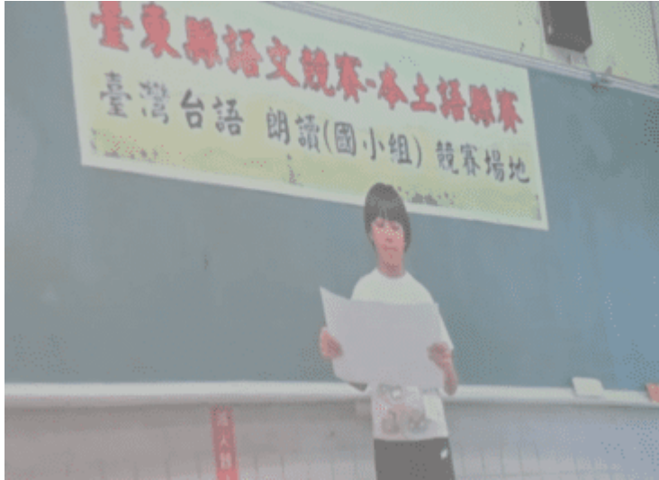
臺灣台語朗讀實況