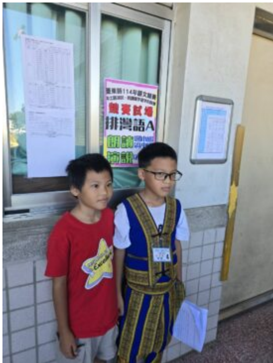
競賽者與家人留影