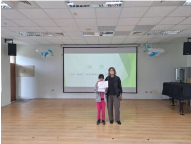
臺灣客語認證頒獎