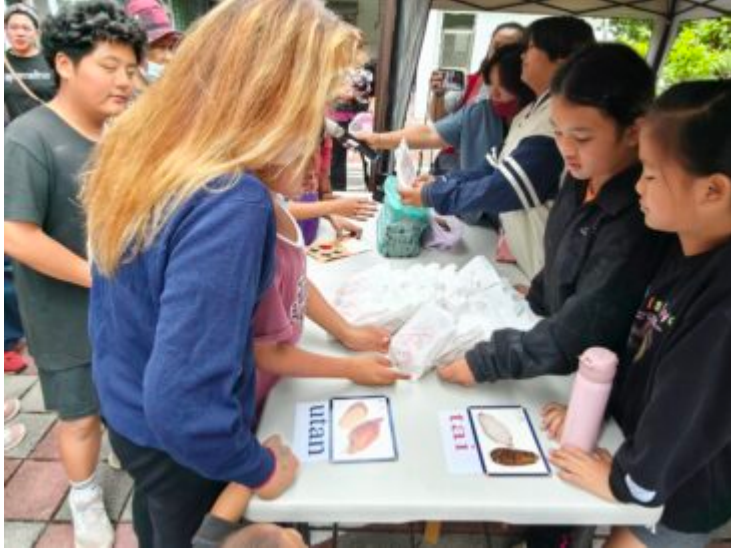
家長帶著孩子至攤位前，使用族語對話領取原民特色美食。