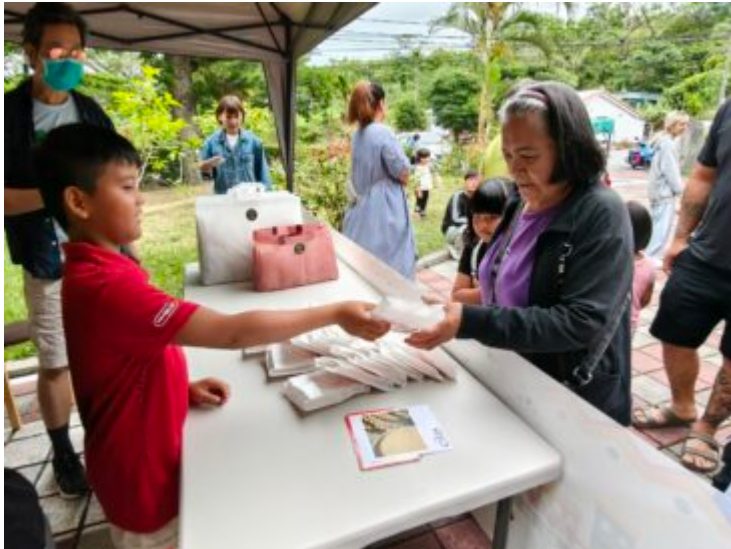
家長帶著孩子至攤位前，使用族語對話領取原民特色美食。