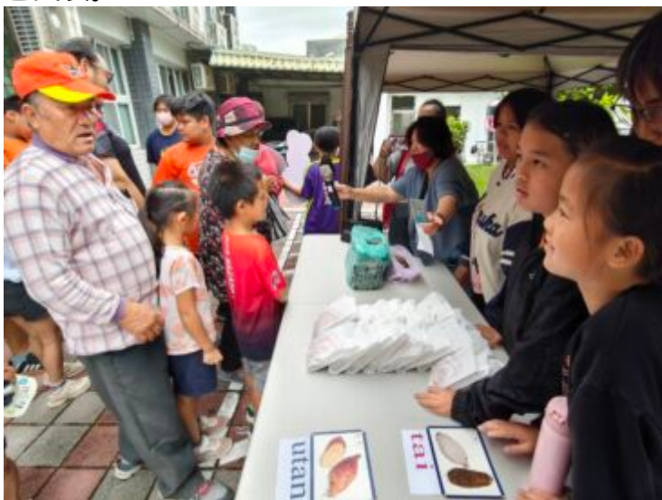
家長帶著孩子至攤位前，使用族語對話領取原民特色美食。