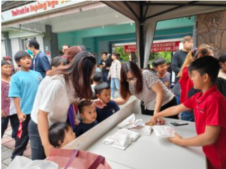
家長帶著孩子至攤位前，使用族語對話領取原民特色美食。