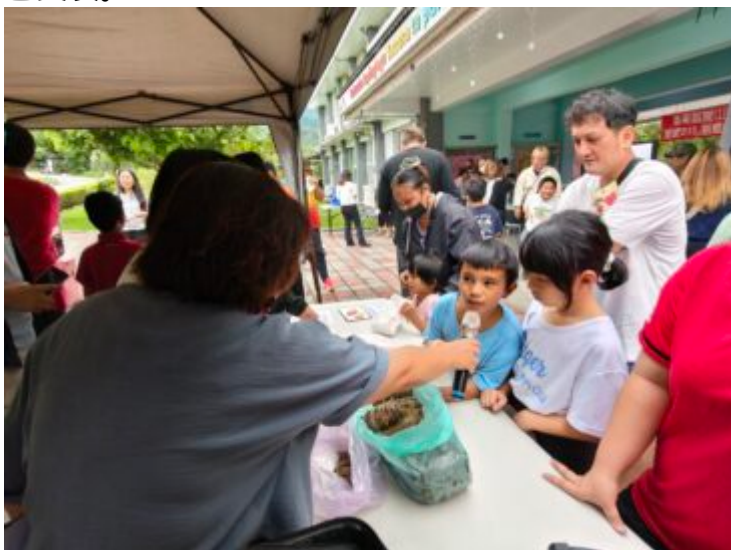
時間/地點：115年5月6日，鸞山國小。