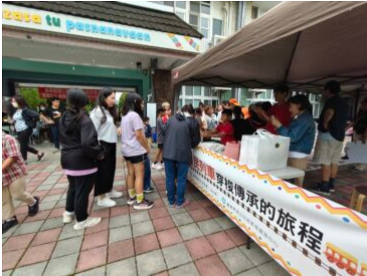
家長帶著孩子至攤位前，使用族語對話領取原民特色美食。