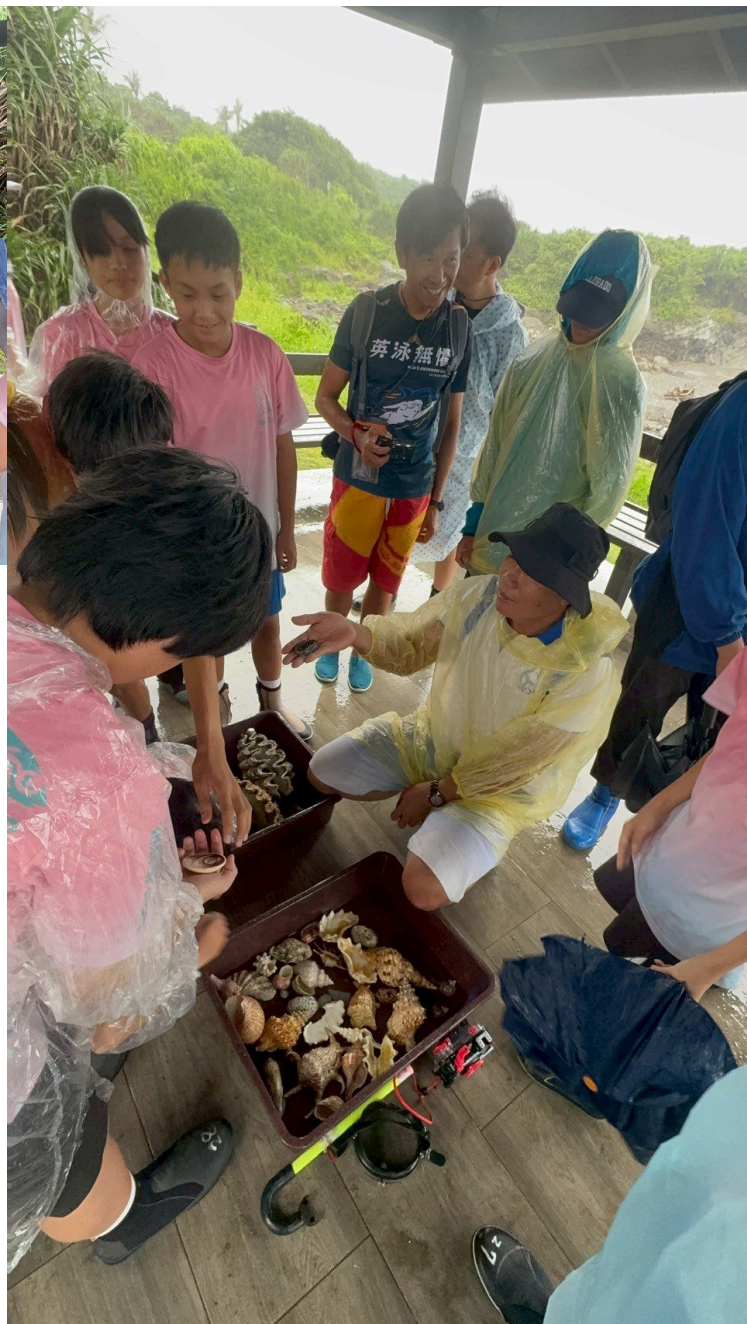
阿美語介紹海洋生物02