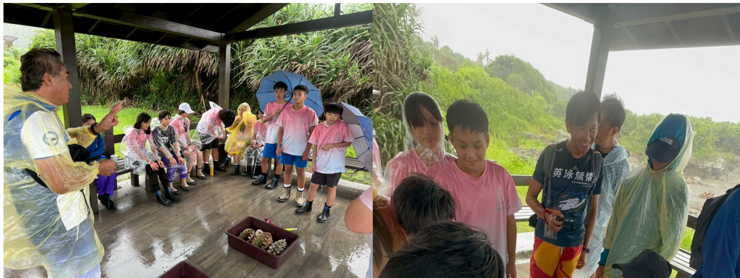
認識阿美族生活環境