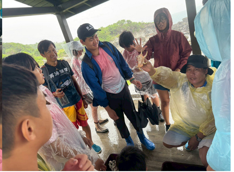
阿美語介紹海洋生物